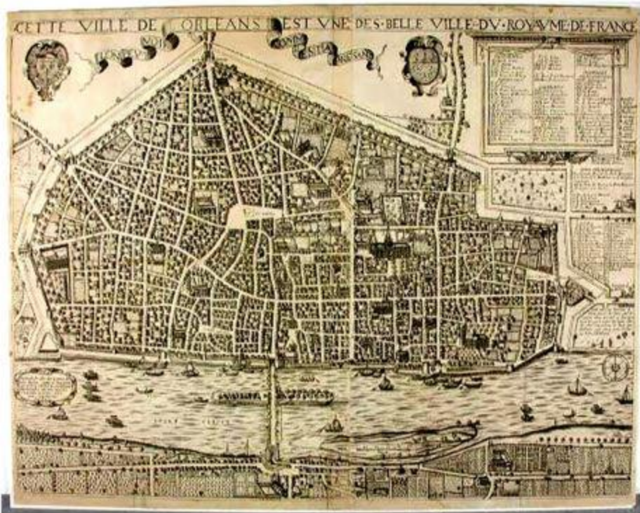
Le plan de Corbière Plan d'Orléans—3 e quart 17 e siècle - 1661 (daté de 1661)