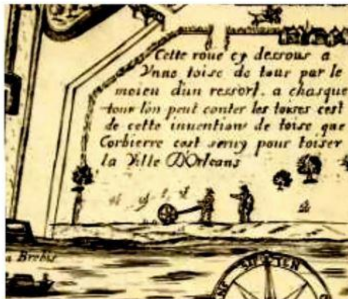
Le zoom sur l'arpenteur à la brouette