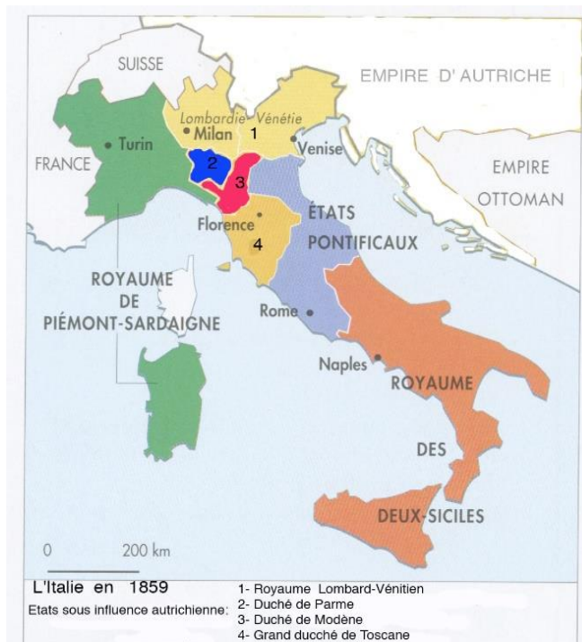
Figure 2 - L'Italie issue du Congrès de Vienne

Un traité franco-sarde est signé en janvier 1859. La France fournissant 200 000 hommes et Victor-Emmanuel, 100 000. En fait c'est l'Autriche qui, devant la mobilisation des forces italiennes au Piémont, prit les devants et donc la responsabilité de la guerre. Le 23 avril 1859, elle exige le désarmement du Piémont dans les 8 jours mais elle se heurte au refus du Piémont. La guerre a été très courte. Ce qui a conduit aux premiers succès c'est la lenteur avec laquelle les généraux autrichiens ont conduit les opérations. Les Français et les Italiens n'avaient pas vraiment de concept stratégique. Les généraux étaient