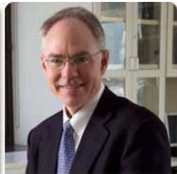
Charles L. Sawyers Memorial Sloan-Kettering Cancer Center

Ces trois scientifiques ont obtenu le prix Lasker-clinique (Lasker-DeBakey) pour le développement d'un traitement de la leucémie myéloïde chronique grâce à une molécule :